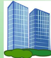
Verifikasi Pendaftaran Ke Fakultas Masing-masing