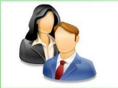
Calon Peserta Wisuda